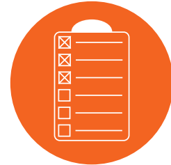
Ökologisch / ökonomisch durch Müllvermeidung