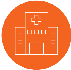
Individueller Standard im Haus

An unserer Seite haben wir mit der KIMAL plc einen starken Partner, der seit über 50 Jahren im Gesundheitswesen tätig ist, in über 71 Ländern die Produkte vertreibt und über 1,6 Mio Sets pro Jahr fertigt.